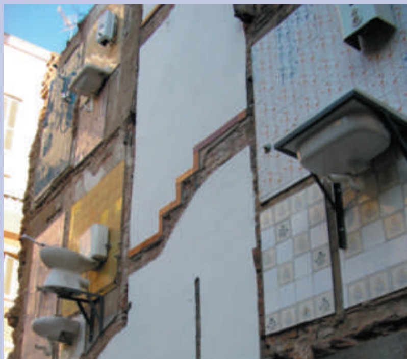
L'artista ha volgut atreure l'atenció sobre les mitgeres, que normalment es procuren amagar o passen desapercebudes.

galeries d'art i altres espais convencionals; així l'art urbà entra pels ulls mentre es va o es ve pel carrer. En aquest cas, va netejar i arreglar la mitgera, va tornar a posar al seu lloc objectes trencats o perduts i va transformar la paret en un decorat teatral, amb tasses de wàter penjant i el rastre dels rajoles enfilant-se paret amunt, que recordaven a quin lloc abans hi havia hagut una escala. No